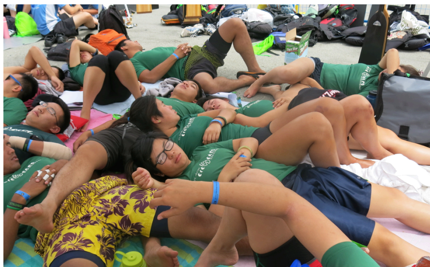
két verseny között

A parkoló többmint 1.5 Km -re volt a sátrunktól s a verseny színhelye a sátrunktól vagy 5-600 méterre. Reggel 8 tol délután ötig ingáztunk a start s a sátor között. Mire újra a parkolóban voltunk 9 óra múlva addigra vagy 10 Km-t legyalogoltunk. Mivel a lámpát reggel rajta felejtettem az autóban így az akkumulátor ledöglött, A törött karomat nem fájlalom csak a combjaimat. Holnap reggel újra evezünk.