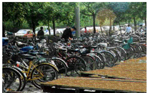
Kinában rengeteg a bicikli

Ha nyerek a lotton vissza megyek a selyem utat végig járni, csak addig tartson ki az egészségem.