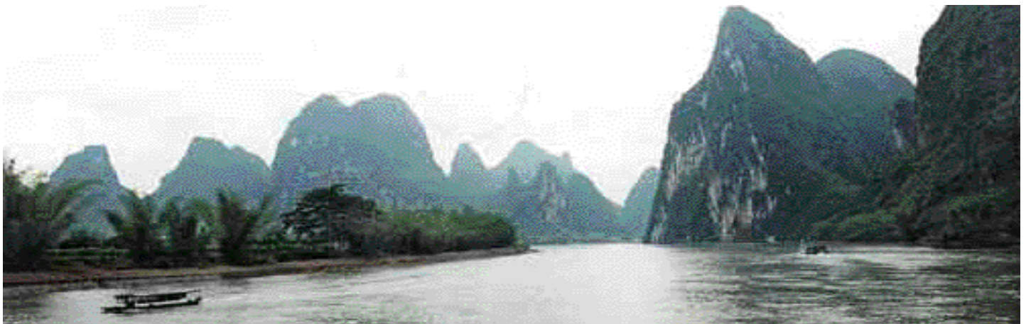
Li folyó, a különleges alakú csodálatos hegyekkel