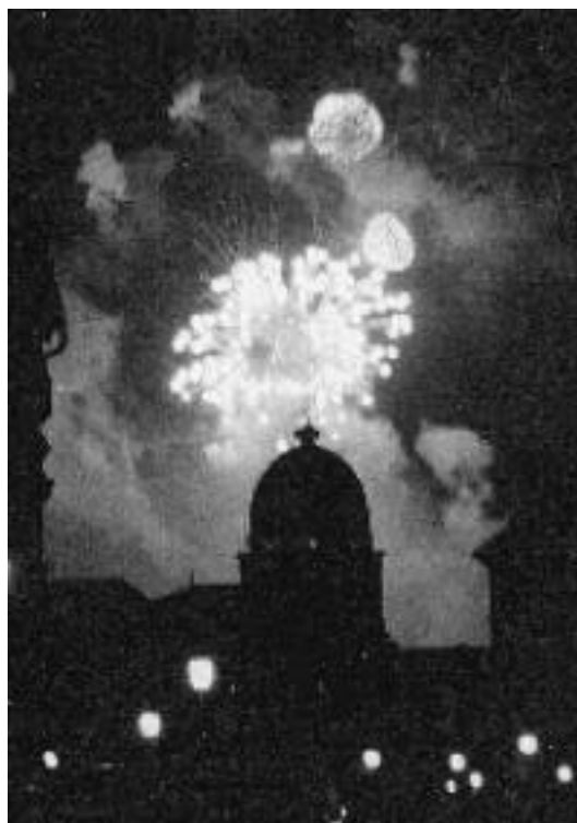
Tűzijáték a várból nézve

Ujra kellett tanulnom Magyarországon az utazgatást is először Pesten a buszokon, földalattin, villamosokon majd később a Volánon és a vasuton. Azt tapasztaltam, hogy a hőség mindenkit bánt, az emberek pihegnek, nem