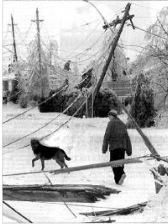
ICE-STORM CORAGE: A szél a hóval együtt szállta a hó és az eső felé a hajókat a Délnyugati, Ont. Széltől